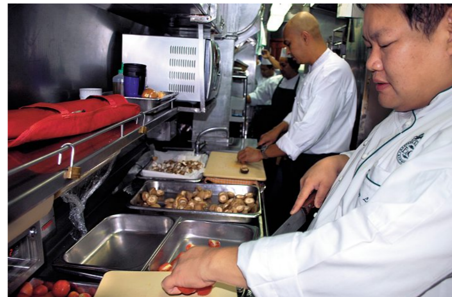
Die Küchenmannschaft bereitet Delikates auf engstem Raum zu.

General, vor dem Häuschen steht und den grün-goldenen Zug durchwinkt. Auch die Bauernfamilien auf dem Land winken dem majestätischen Nostalgiezug freudig zu, der mit rund sechzig Stundenkilometern durch die Landschaft fährt. Besonders nahe an der Wirklichkeit Thailands ist man jedoch erst auf dem offenen Aussichtswagen. Während der Fahrt durch den Regenwald können einen dort schon mal die vorbeihuschenden Zweige kitzeln. Aus