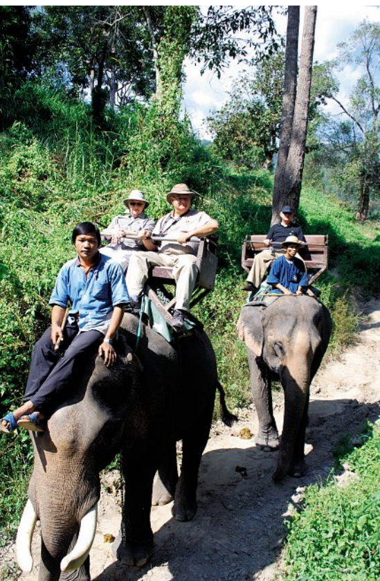
In Chiang Mai können die Reisenden einen Ritt auf einem Elefantenwagen.