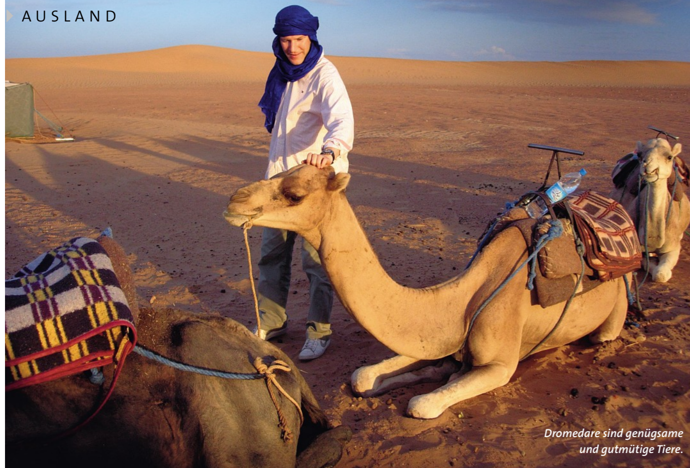
Dromedare sind genügsame und gutmütige Tiere.

mit Büro in Zagora, einem Städtchen sechzig Kilometer nördlich und damit näher der Zivilisation.